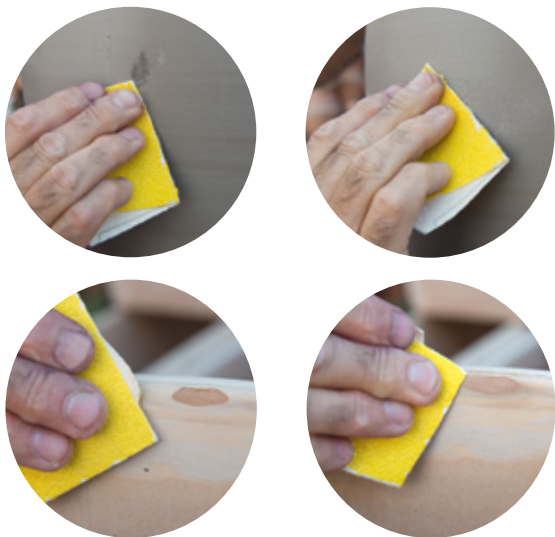
AVANT / APRÈS

Les nettoyeurs haute pression type karcher sont utilisables sur nos produits. Pour effacer les petites tâches ou réparer une ébréchure sur votre pot, frotter à l'aide d'un papier de verre.